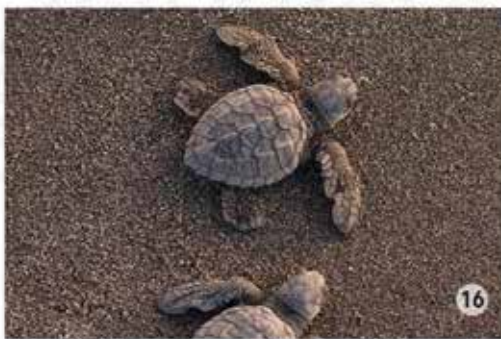
16. Campamento tortuguero de Puerto Arista / Sectar.