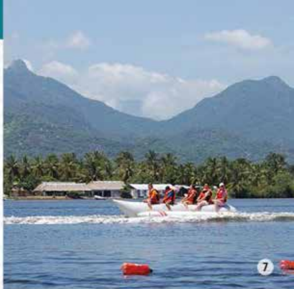
7. Boca del Cielo