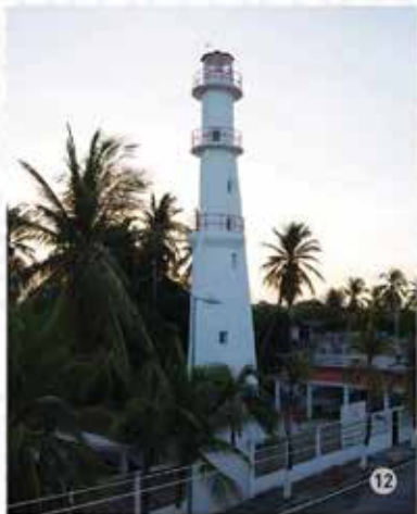
12. Faro de Puerto Arista / Sector.