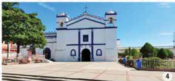
3. Zona Arqueológica de Iglesia Vieja / Noé Zenteno. 4. Iglesia de San Francisco

Monumento histórico que data del siglo XVIII, destaca su retablo de madera, revestido de oro bruñido. En esta parroquia fue celebrada una misa en el año 1821 por la independencia de México.