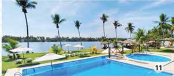
10. Chochohuitl. 11. Refugio del Sol / Gob. del Estado.

Es una playa a mar abierto y del otro lado es un estero lleno de mangles. Ofrece lugares y servicios para la práctica de actividades deportivas de playa. En el estero se pueden observar: aves acuáticas y playeras, cocodrilos, caimanes, flora característica de la zona como mangle rojo y el árbol el chochohuite (del cual deriva el nombre de la comunidad). Se pueden realizar actividades de pesca recreativa, natación, kayak, paseos a la boca barra, donde se aprecia la conexión del mar (océano Pacífico) con el estero, y saborear deliciosos platillos de mariscos típicos de la región ofrecidos por el Centro Turístico Ribera de Playa Azul.