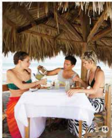
14. El Madreal / Gobierno del estado de Chiapas.