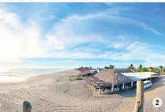
Foto de portada: Tortugas de Puerto Arista 1. Chocohuital. 2. Playa del Sol

Sobre las mismas playas de Puerto Arista, a escasos 2.5 km se encuentra este centro turístico que constituye el sitio ideal para realizar paseos en moto. Es uno de los lugares más atractivos para admirar los atardeceres del océano Pacífico.