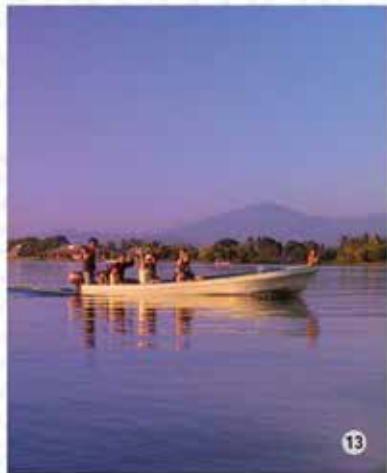
13. Costa chiapaneca / Rincones de mi tierra.