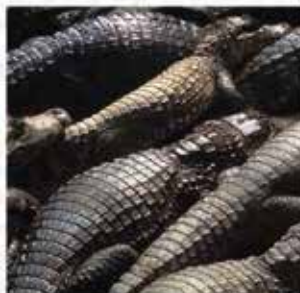
6. UMA "El Caimán"