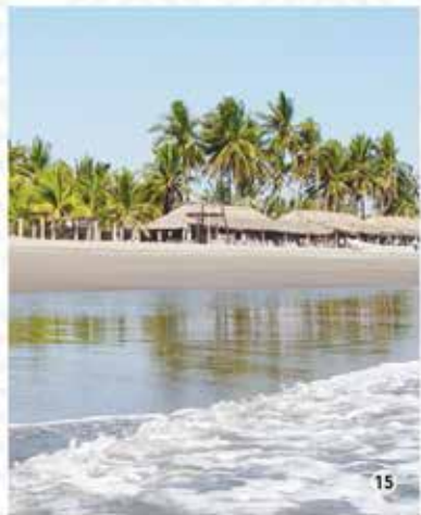
15. Puerto Arista / Sector.