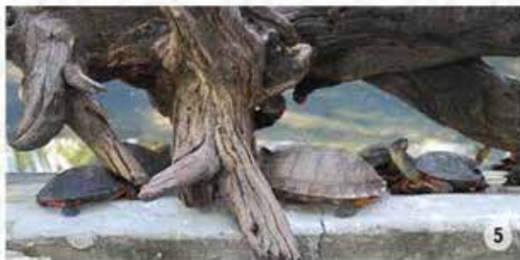
5. Campamento tortuguero

Este es uno de los santuarios de la tortuga marina de la especie golfina, donde se brinda la protección necesaria para preservar a este legendario omnívoro. Recibe visitantes durante el periodo de arribo de la tortuga, que es de julio a octubre; bajo la premisa de sensibilizar a los turistas mediante recorridos nocturnos, siempre en coordinación con el personal de la CONANP. De julio a diciembre es posible participar en la liberación de tortugas en la playa.