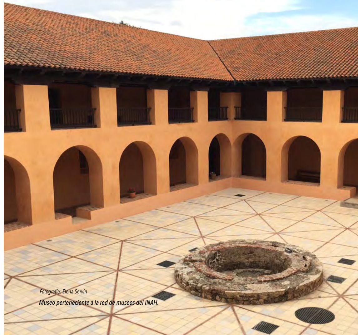
Fotografía: Elena Servín

Instituto Nacional de Antropología e Historia